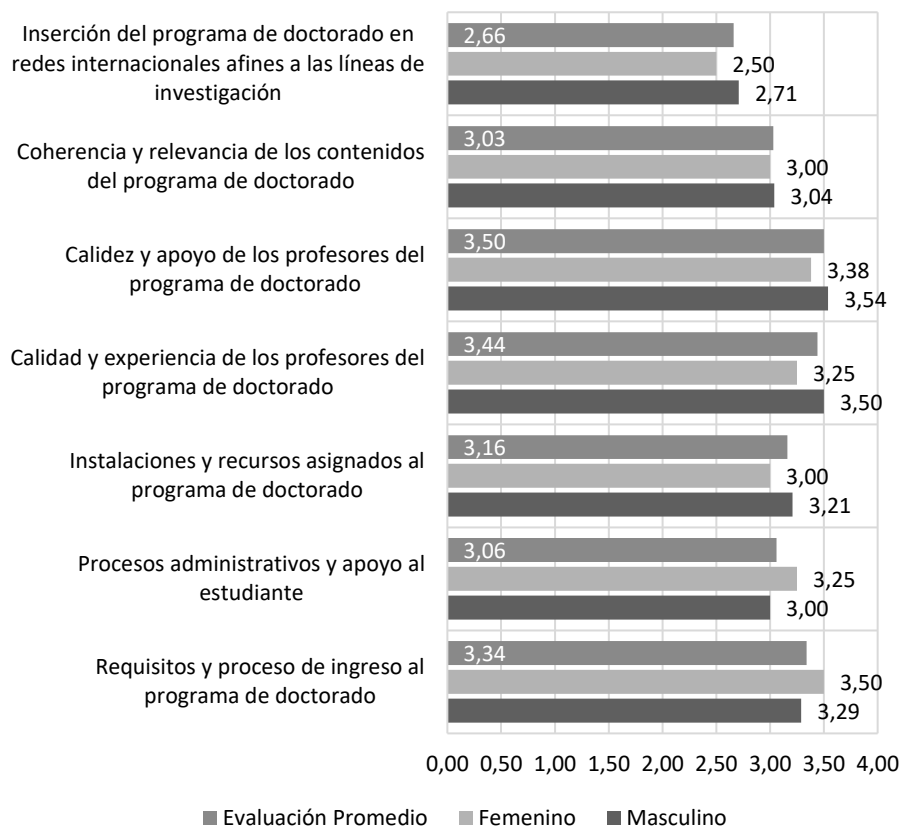
Figura 2. En general y hasta este momento, ¿qué tan satisfecho se encuentra con las siguientes características de su programa de doctorado?

En síntesis, en cuanto a los aspectos académicos, los estudiantes consultados parecen estar satisfechos con los procesos generales de los programas a los cuales se encuentra registrados. En cuanto a las temáticas de investigación estas se concentran en las áreas que podrían denominarse tradicionales en el campo de estudio de la Administración. También se detectó cierta ambigüedad en lo que concierne a las pasantías de investigación internacional y los convenios que deberían soportar este tipo de práctica. Y, sobre los aspectos administrativos, existen oportunidades de mejora que permitan garantizar todo lo anterior.