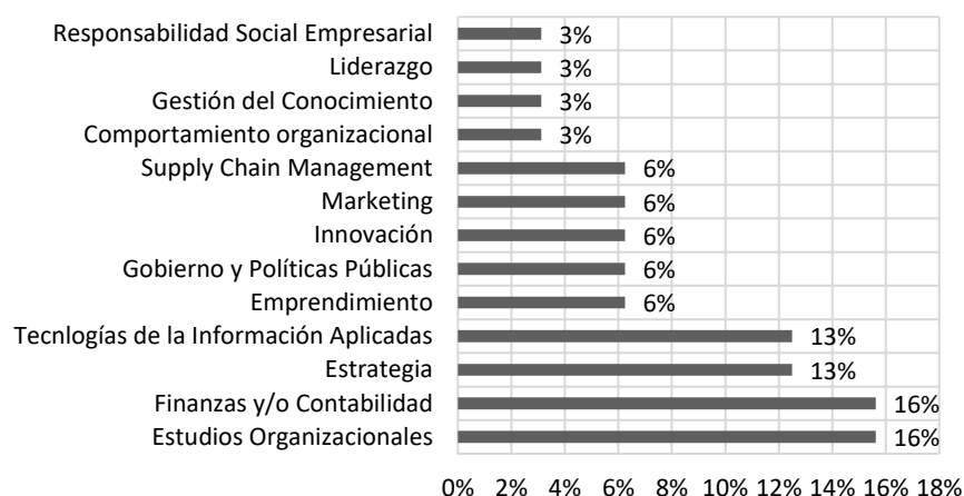
Figura 1. ¿En qué línea de investigación enmarca su proyecto de investigación doctoral?

Especialmente en lo relacionado con las temáticas al campo de estudio, es posible identificar que las áreas que cuentan con mayor participación por parte de los estudiantes consultados son las concernientes a los estudios organizacionales, las finanzas y la contabilidad, y el área estratégica (Figura 1), pero es claro que otros campos de conocimiento asociados al management también están presentes. Es probable que las preferencias de estos campos sobre otros se deba, entre otras cosas, a la fortaleza que han desarrollado las universidades en sus grupos de investigación, así como a la formación de los tutores y las líneas de investigación que ofrecen a sus estudiantes.